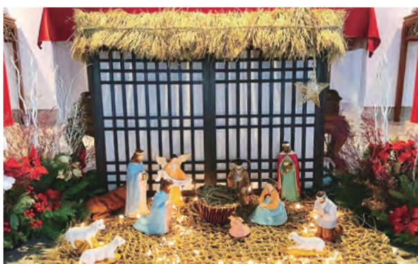
▲祭台前的質樸馬槽，從建築到服飾都充滿韓風，引人細細品賞，安靜朝拜。

禮成曲後，鍾總主教到各個馬槽去灑聖水祝福，並頒發菲律賓教友學習中文課程的第2期結業證書，結業生穿上真人馬槽的裝扮，讓大家耳目一新，紛紛留影；中午的共融會餐，宛如小型聯合國，肢體語言與菲腔、韓調國語帶來笑語不斷，愛無國界，愛無等差，在萬應聖母的轉禱中，共融於主愛內！