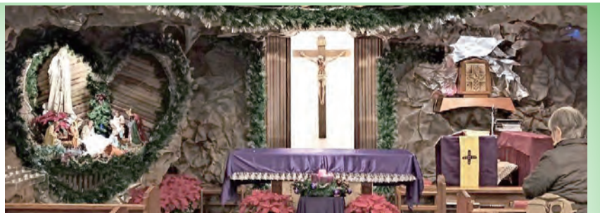
▲台北富錦街法蒂瑪聖母堂的「心」馬槽，充滿創意與省思。

值得分享的是馬槽搭建的兩大特點——創新與環保，創新是以獨一無二的「心」造型呈現，提醒大家用「心」朝拜耶穌聖嬰，用「心」感受主愛；傑克神父每年做馬槽都有不同造型：2018年是泉水從天而降流經馬槽，潺潺水聲配上蟲鳴鳥叫，讓朝拜者有身臨其境；材料是竹子和牛皮紙，蓄水池用廢棄的浴缸，經濟又環保！今年除了LED與樹藤外，主材料也是竹，竹的韌性高，塑形很強，馬槽壁與天花板以竹支撐，再固定牛皮紙造型；傑克親力親為，經常挑燈夜戰；製作過程中的水、電、木作等，沒有一項假手他人，還自己騎著摩托車上山砍竹、鋸竹、劈竹，裝上貨車運回教堂；除了釘槍和