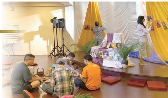
▲一起布置明供聖體祈禱會場地 ◀從自然環境裡，看見天主創造世界的奇妙。