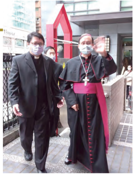
▲鍾安住總主教向各國的教友們親切問候