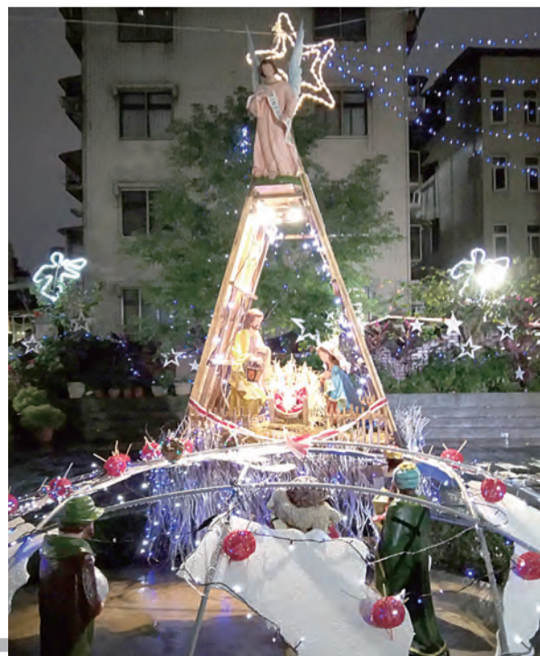
▲基督之光所呈現的氛圍應是幽微、寧靜、溫馨與神聖，而非熱鬧繁華。