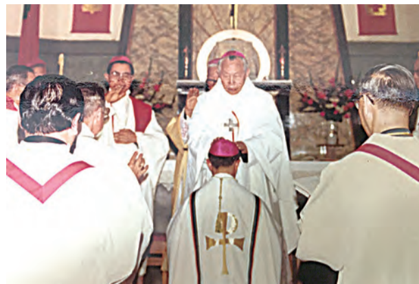
▲1981年，羅光總主教禮劉獻堂主教晉牧大典。