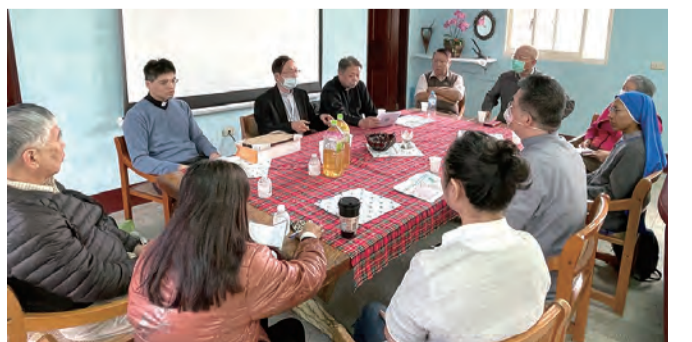
▲鍾安住總主教聽取耶穌聖心堂傳協會堂務彙報