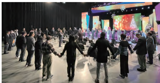
▲與會者們手牽手、心連心祈禱，虔敬信仰氛圍瀰漫攝影棚。

祈禱會精心策畫天主教神長及基督教牧者，帶領全體同心合意地針對5個祈禱意向：為國家、為天主教與基督教合一、為TVBS結合宗教傳播福音、為「聖誕愛無限」福音大豐收，以及為所有社群媒體成為福傳利器等祈禱；與會者們手牽手、心連心，向天主