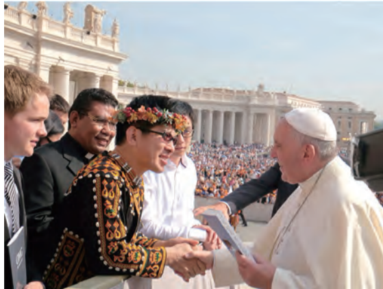
▲本文作者陳世賢（左）觀見教宗方濟各，並致贈他所寫的《Your Jesus! My Buddha!》