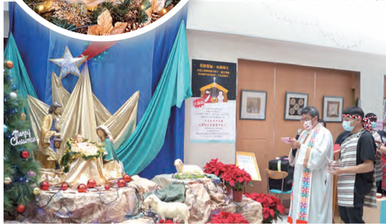
▲耕莘醫院以「馬槽耶穌，為愛而生」布置馬槽展開聖誕系列慶祝活動。