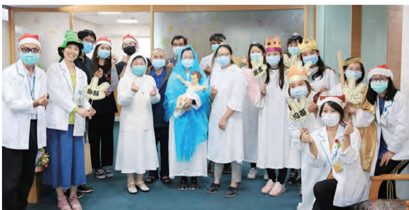
▲院牧部與南華大學社工組的學生志工，向院長室喜樂報佳音。