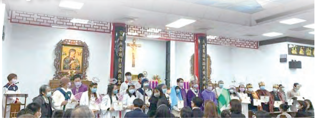
▲真人馬槽裝扮的菲律賓學習中文課程教友們，歡喜領到第2期結業證書，把握機會與神長們合影！