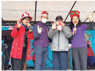
▲▲在萬坪草坪舉行盛大的聖誕音樂會，報佳音，整合各種資源，吸引數百人喜樂共融，迎接耶穌聖嬰的降臨。

有效管理規畫與執行： 工作小組分為行銷推廣、創意馬槽與祈願牆作業組、音樂會現場工