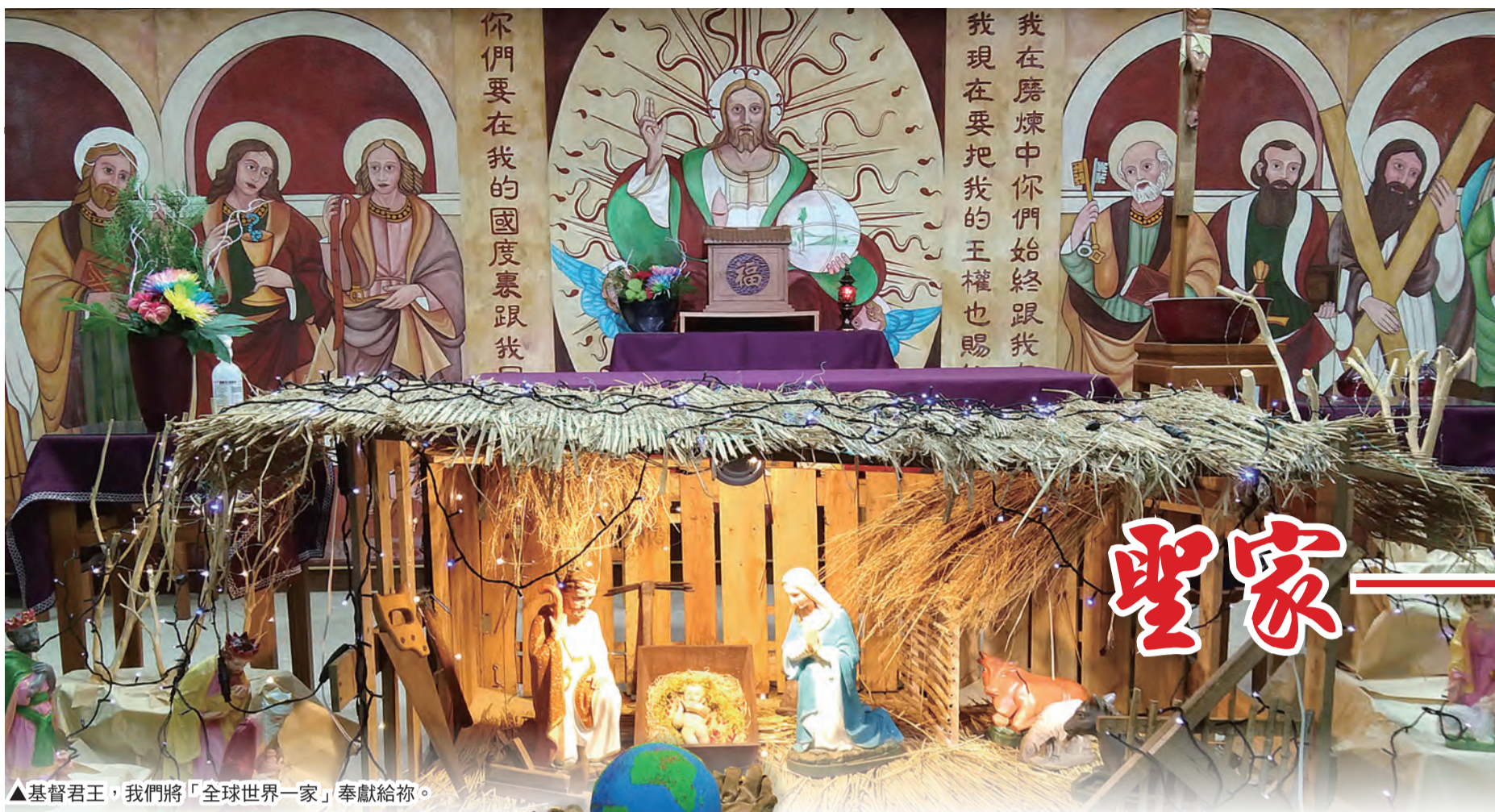
▲基督君王，我們將「全球世界一家」奉獻給你。