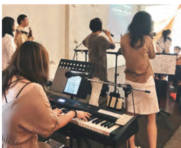
▲用音樂敬拜讚美天主，向天主祈禱。