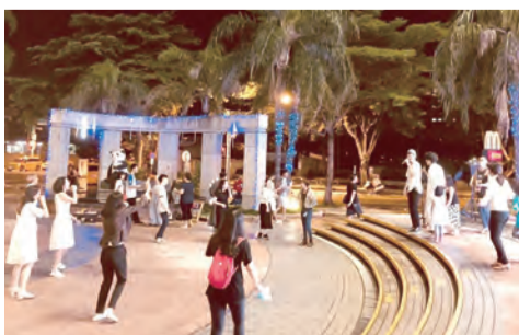
▲在廣場讚美天主，用歌聲傳播天主的愛。