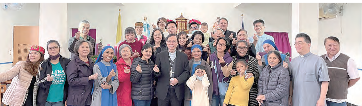
▲鍾安住總主教（前排中）與耶穌聖心堂教友們歡喜合照，開心獻愛！