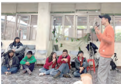
▲分享生命故事，為天主作見證。

從2015年那個晚上至今，大博爾已經成了我的家，天主是我們的父親，耶穌是照顧我們的大哥。我們彼此分享生活的喜怒哀樂，幫助彼此在天主的愛內成長茁壯，見證一次又一次天主在