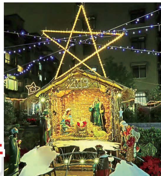
◀馬槽內小耶穌光芒內斂，綻放無限希望之光。因為「在祂內有生命，這生命是人的光。」（若1：4）