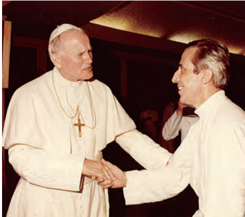
▲畢生致力於宗教交談的馬天賜神父（右）觀見教宗聖若望保祿二世，晤談甚歡。