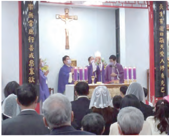
▲長安萬應聖母堂以三語並行彌撒感謝天主沛降隆恩