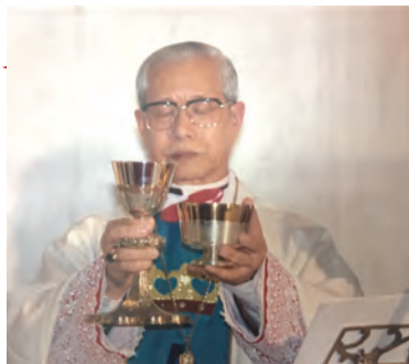
▲劉獻堂主教於1983年就職感恩祭